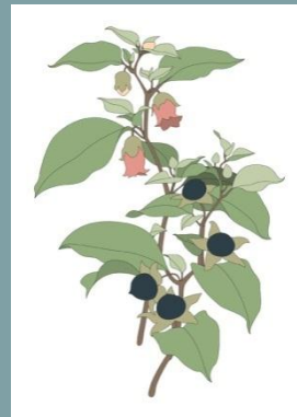
6. Massimo Dalla Pola