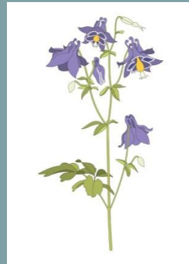
5. Massimo Dalla Pola

4 - 14 dicembre 2012 lunedì - sabato dalle ore 10.00 alle ore 19.00 www.bambinocardiopatici.it Milano, CorsoMagenta10 per l'Arte