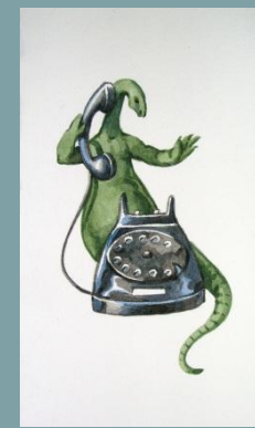
3. Vanni Cuoghi