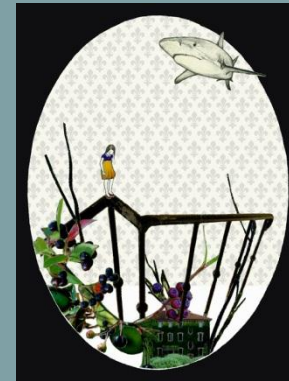
8. Alice Colombo

info adicorbeta comunicazione@adicorbeta.org skype: adicorbeta comunicazione facebook: adicorbeta