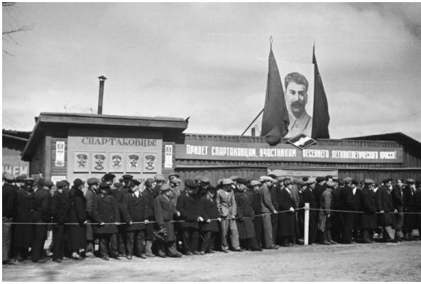
Spectators at a stadium. Leningrad (now St. Petersburg), USSR/Russia, c. 1930s. ("Greetings to members of the Spartak Sports Society")