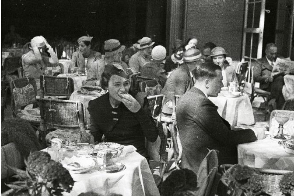
In a street cafe. Berlin, Germany, c. pre-1936.