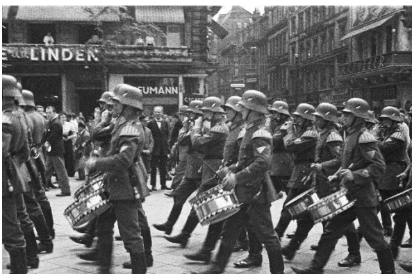
Parade in central Berlin. Berlin, Germany, c. pre-1936