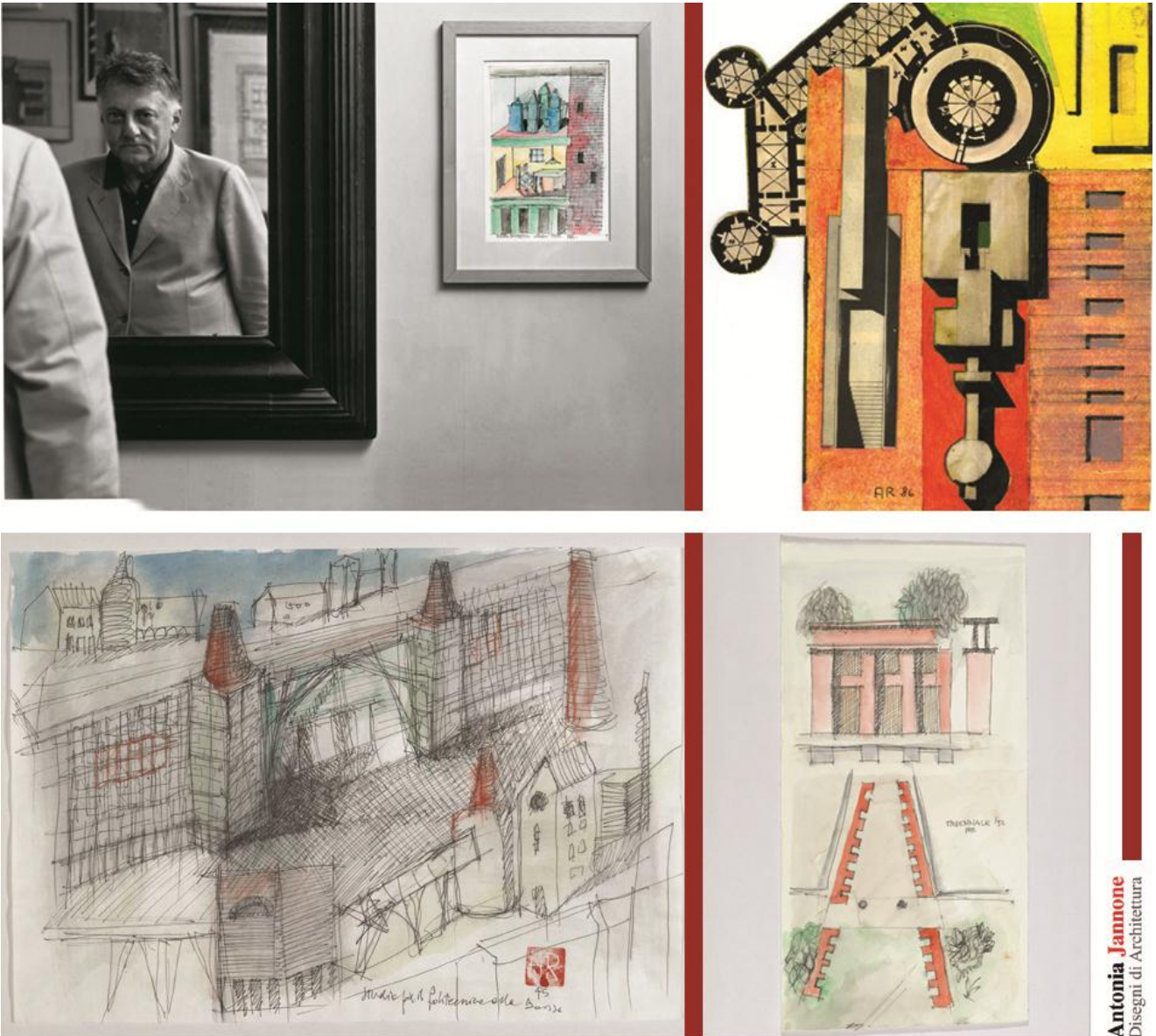
Antonia Jannone Disegni di Architettura