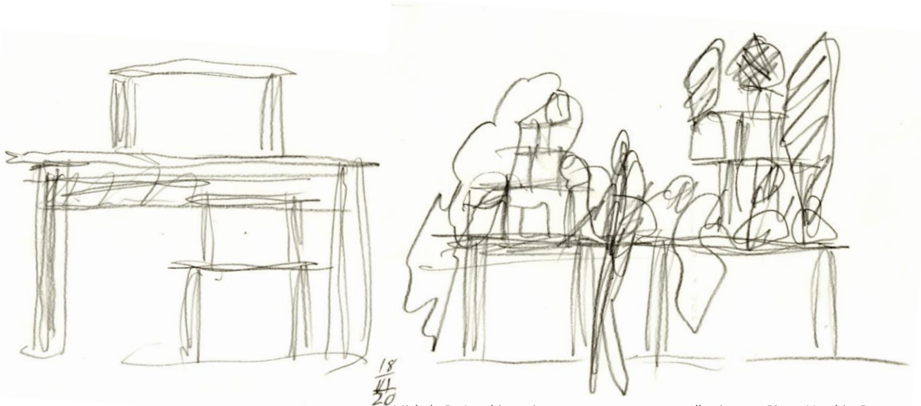
Michele De Lucchi, matita su carta, progetto per allestimento Piazza Vecchia, Bergamo